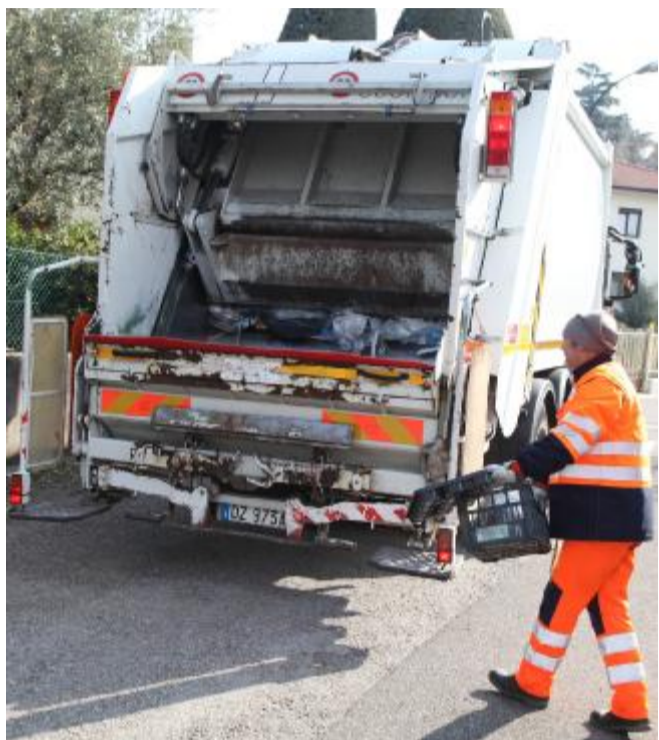
La raccolta dei rifiuti nella zona di Mason, Molvena e Pianezze. CECCON

La diatriba giudiziaria, dunque, si arricchisce di un nuovo capitolo. Le amministrazioni comunali, nel settembre del 2013, decisero di andare in gara ritenendo che questa strada potesse portare a una maggiore economicità del servizio. La scelta fu prontamente aversata dall'Etra che, al termine della gara d'appalto, ricorse al Tribunale amministrativo regio-